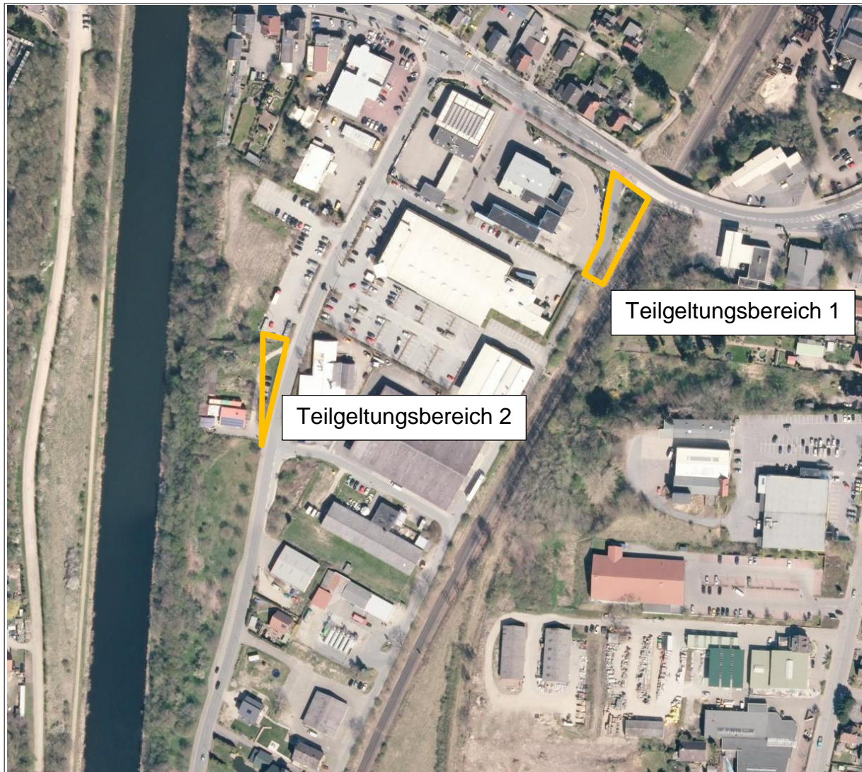
Luftbild Geltungsbereiche Teilaufhebung Bebauungsplan Nr. 41.3.1 Stadt Mölln

Teilgeltungsbereich 1 des Plangeltungsbereiches ist durch eine Verkehrsfläche mit Straßenbegleitgrün geprägt (siehe Luftbild). Teilgeltungsbereich 2 wird derzeit als Parkplatz- sowie Rasenfläche genutzt.